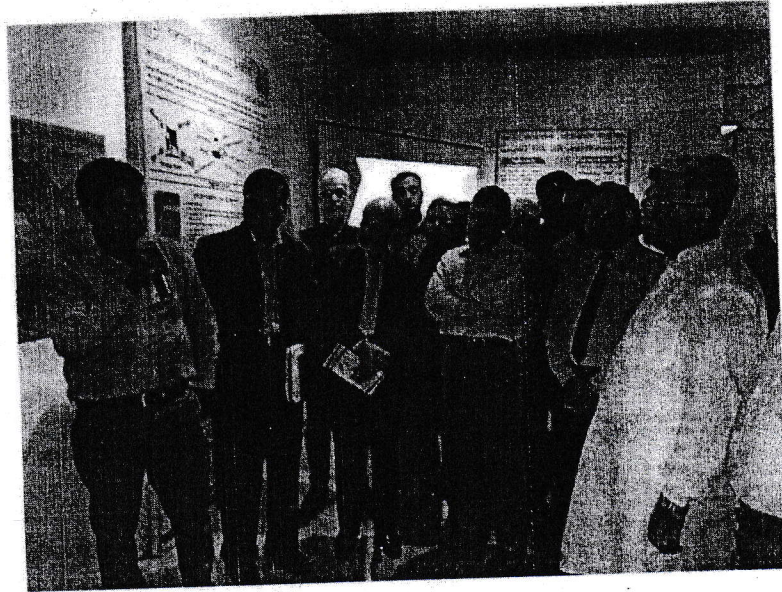
চিত্রঃ শোকেসিং কর্মশালায় বিএলআরআই এর অংশগ্রহণ